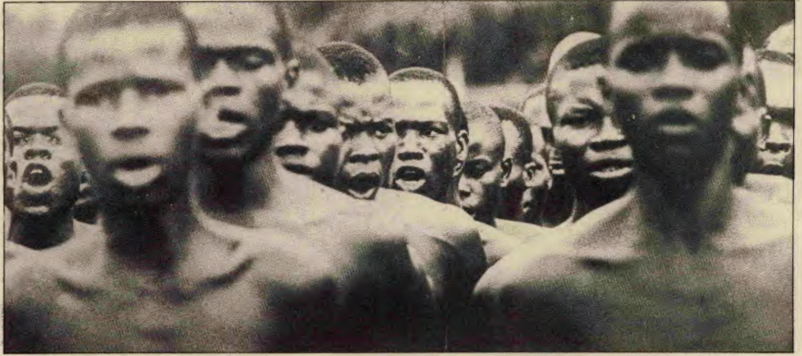
Sendikal ve siyasal birliğini sağlamış, devrime yürüyen G. Afrika işçi sınıfını ve emekçi halkını hiçbir güç durduramayacaktır.

Chun, zaten devede kulak misali olan demokratik hakları daha da kısıtladı, burjuva muhalefeti susturdu. Son yıllarda ülkede sınıf savaşımının iyice yükselmesiyle birlikte Chun rejimine muhalefet yükseldi. Burjuva mu-